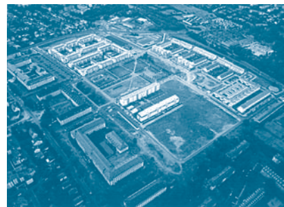
Konversionsplanung Lee-Barracks – abgeschlossen