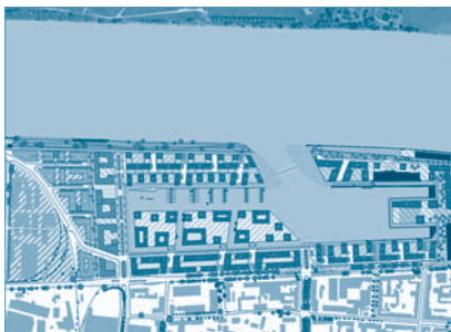
Rahmenplan Zoll- und Binnenhafen