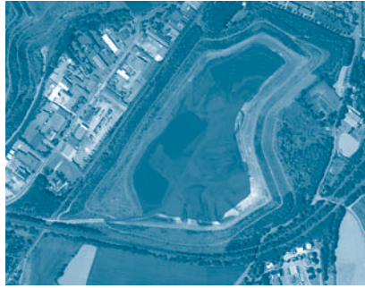
Halde Duisburg Lohmannsheide