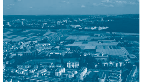
Nutzungskonkurrenz im Freiraum der Filder, sich ausbreitende Wohnbebauung und Verkehrsinfrastruktur