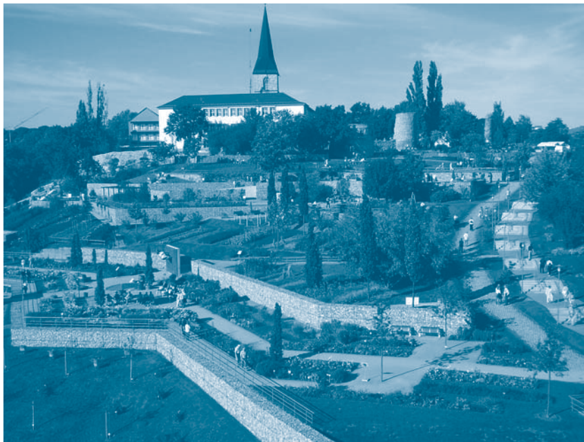
Realisierung der Landesgartenschau 2004 in Nordhausen auf einer Brachfläche im Zentrum der Stadt