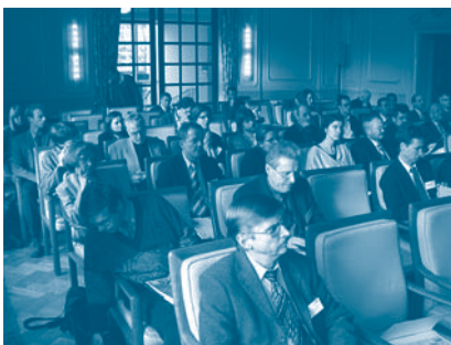
Blick ins Publikum