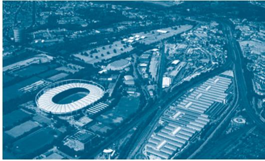
Ehemaliger Güterbahnhof Stuttgart-Bad Cannstatt, 22 ha ehem. Brachfläche