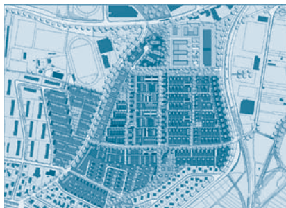
Planung Wohngebiet Gonsbachterrassen