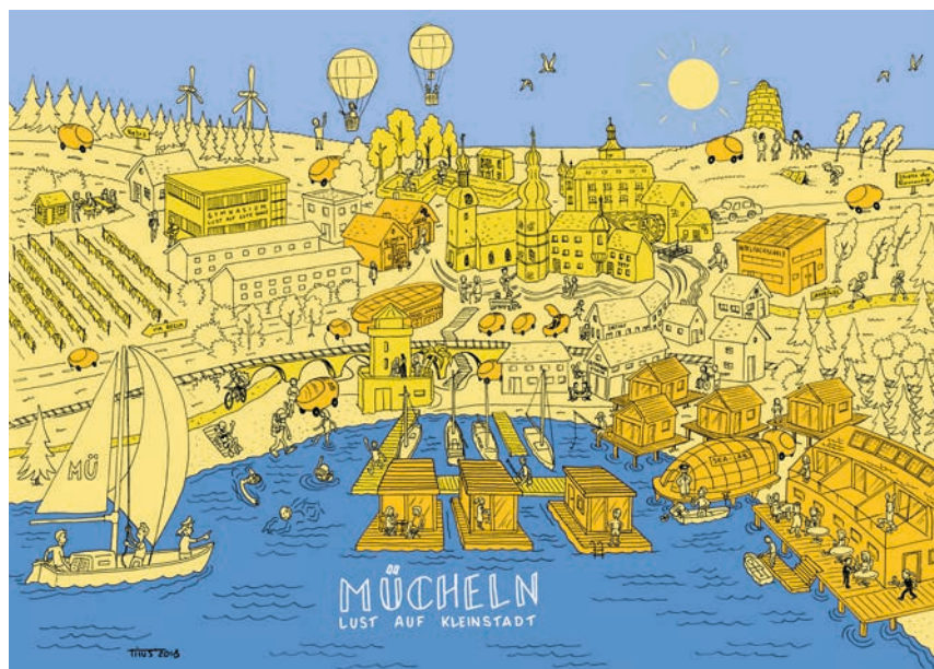
Zukunftsbild Mücheln 2030 Zeichnung: TITUS