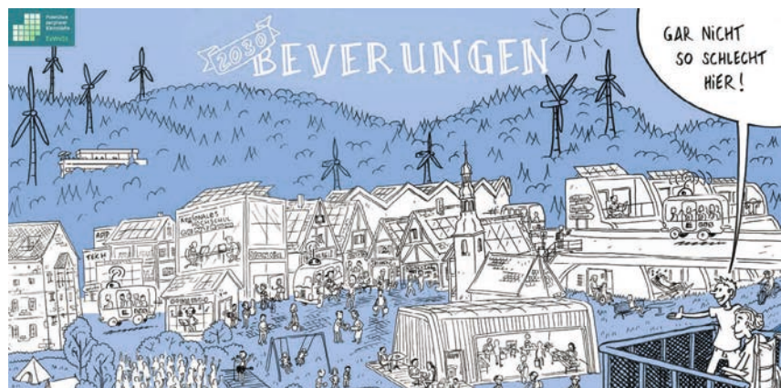
Zukunftsbild Beverungen 2030 Zeichnung: TITUS