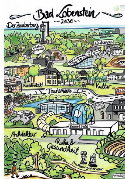
Zukunftsbild Bad Lobenstein 2030 Zeichnung: Anna Luise Sulimma