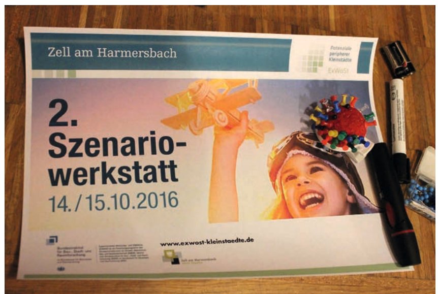
Szenariowerkstätten – ein Weg in die Zukunft

rung durch Koproduktion von Lebensqualität, Wertschöpfung und Daseinsvorsorge in Stadt und Region. Die dafür notwendige Zusammenarbeit von Bürgerschaft, Wirtschaft, Politik und Verwaltung entsteht nicht unbedingt von selbst. Es geht vielmehr darum, Strukturen und Räume zu schaffen, die es den Partnern erlauben, sich auszutauschen und gleichberechtigt und aus der jeweils eigenen Perspektive eine Vielfalt von Ideen und Initiativen zu entwickeln. Politik und Verwaltung müssen bereit sein, sich auf kreative und ergebnisoffene Beteiligungsformate und -prozesse einzulassen, die diesen kreativen Austausch ermöglichen und die Ergebnisse und das entstandene (soziale und ökonomische) Unternehmertum aufgreifen und fördern. Solche Möglichkeitsräume sind z. B. Jugend-BarCamps und Szenarioprozesse, wie sie im Forschungsfeld erprobt worden sind.