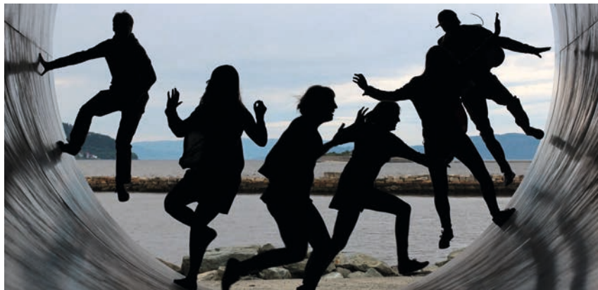
Jugend will ihren eigenen Ort – gestalten.

Strukturen. Die Teilnehmer und Teilnehmerinnen der Szenariowerkstätten sahen eine Antwort darauf in Zusammenarbeit und Vereinskoooperation. Darüber hinaus wurde auf eine stärkere Wahrnehmbarkeit und Anerkennung der Vereinsarbeit gesetzt. Gemeinschaft und Vorbeugung von Vereinsamung wurde auch im Themenfeld Wohnen diskutiert.