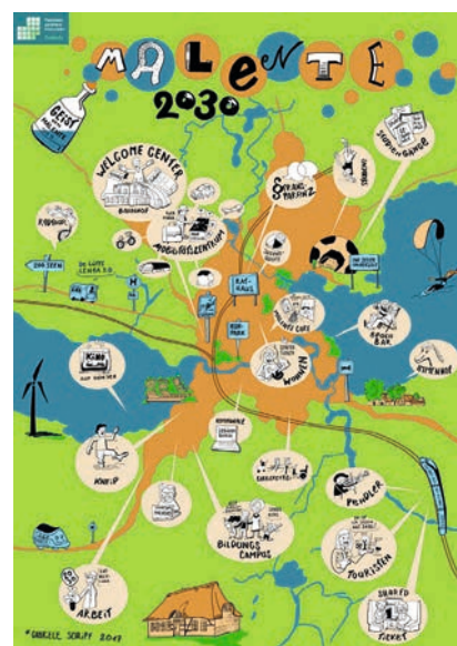
Zukunftsbild Malente 2030 Zeichnung: Gabriele Schlipf