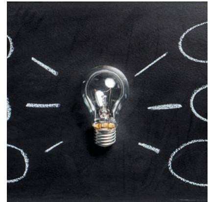
Raum für Innovationen – Spaces, Labs und Places

sche Lernorte dienen. Wissen, Technik, Arbeit, Mahlzeiten und Freizeit werden geteilt und gehen eine neue Symbiose ein. Die traditionelle Bibliothek wird neu gedacht, als Ort für digitale Kompetenz, Innovation und Ort zum Arbeiten. Der Einzelhandel schließt sich zu einem „Städtlekaufhaus“ zusammen, bietet seine Produkte über Online-Marktplätze und Bringdienste an, setzt auf guten Service, die Verknüpfung von Online- und Offlinehandel, Cross-Over-Konzepte sowie gute, regionale Produkte. Es entstehen Selbstvermarkterplattformen und Markthallen.