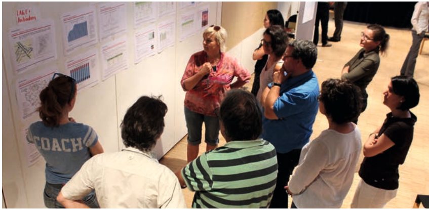
Kleinstädtische Urbanität ist bürgergetragene Urbanität

ein Teil neben vielen anderen, wie z.B. Vereine, Traditionen oder Vertrautheit. Zudem enthält der Begriff „Urbanität“ auch immer den Blick in die Zukunft. Wir wünschen uns mehr Urbanität, ohne genau zu wissen, was das im Detail sein kann. Auch dieser Wunsch bzw. die Suche nach mehr Urbanität und der eigenen kleinstädtischen Lebensqualität wurde immer wieder in den Szenariodiskussionen deutlich und Konturen davon lassen sich in den acht Szenariogeschichten und Zukunftsbildern erkennen.