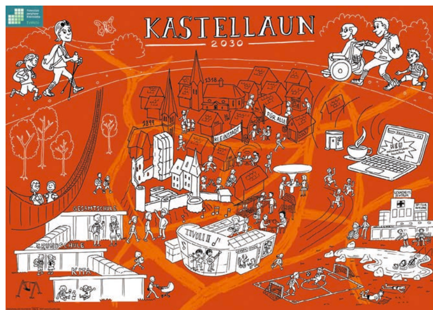
Zukunftsbild Kastellaun 2030 Zeichnung: TITUS