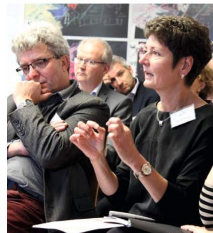
Erfahrungsaustausch und gemeinsames Lernen

Der Austausch mit anderen Kleinstädten kann wertvolle Impulse für die eigene Arbeit liefern. Vielerorts sind bereits Ideen entstanden, die Anhaltspunkte für die Lösung der im Prozess identifizierten eigenen Probleme bieten. Es geht dabei darum, das Prinzip der Problemlösung zu verstehen und auf die eigene Situation anzuwenden. Diese Erkenntnisse können gerade im Austausch erschlossen werden.