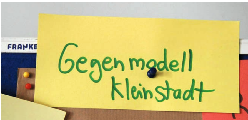
Kleinstädte als lebenswerte Alternative zu Großstädten

Urbanität und Kleinstadt – ein Widerspruch? Mit dem Blick auf das Leben in Großstädten mag es vielen Lesern und Leserinnen so vorkommen. Aber Kleinstädte sind eben auch Städte, also nicht ohne Weiteres dem Land zuzuschlagen. Urbanität ist nicht nur auf Großstädte beschränkt. Es gibt auch eine spezifisch kleinstädtische Urbanität als Ausdruck eines guten, facettenreichen, sozial und kulturell toleranten Lebens in der Kleinstadt. Diese These vertritt eine im Forschungsfeld erarbeitete Expertise, deren Ausgangspunkt die Frage nach den Zukunftschancen von Kleinstädten in peripheren Lagen war. Zur Schärfung der Fragestellung wurde eine explorativ angelegte Online-Befragung durchgeführt, an der sich insgesamt 300 Personen beteiligten. Dabei wurden Kleinstadtvertreter mit unterschiedlichen Thesen zu Merkmalen und möglichen Zukunftsstrategien von Kleinstädten (mit Fokus auf den ländlichen Raum) konfrontiert.