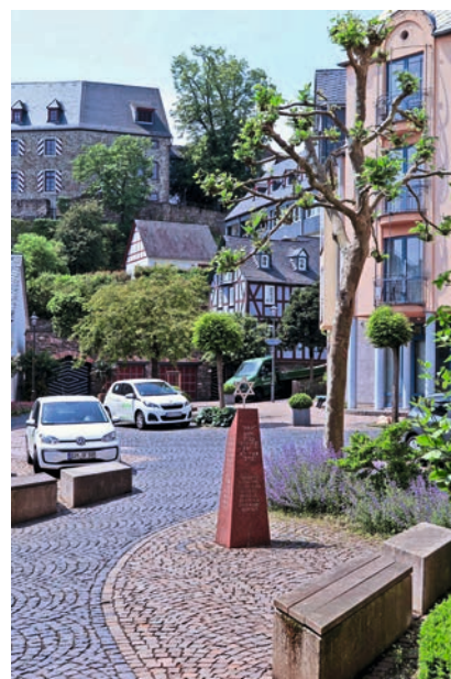
Lebensqualität in der Kleinstadt

Mobilität und Erreichbarkeit der nächsten Zentren sowie die Anbindung der Ortsteile an die Kernstadt sind für alle Bevölkerungsgruppen wichtig. Bahnverbindungen und regionale Schnellbuslinien gewinnen