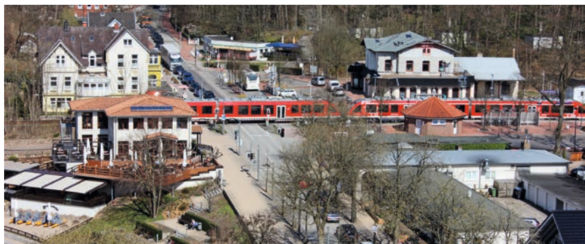
Malente – lebendige, lebenswerte Kleinstadt zwischen zwei Seen

rigen Umständen zu behaupten und mit wirtschaftlichen und sozialen Krisen und Brüchen umzugehen. In jedem der acht Modellvorhaben gibt es Geschichten dazu. Das Leben in der peripheren Kleinstadt ist schon aus der Tradition heraus von den Bürgern getragen. Das wird z.B. an den vielen vereinsgetragenen Sport- und Kulturangeboten deutlich. Dieses Bürgerengagement ist aber auch notwendig, weil es weniger professionelle und institutionelle Angebote gibt als in der Großstadt. In der Kleinstadt sind es eher einzelne Personen, ihre Aktivitäten und Beziehungen untereinander als Strukturen und Institutionen, die die Lebensbedingungen gestalten und damit die kleinstädtische Urbanität ausmachen können. Die Bürger können somit zu Agenten des Wandels werden. Sie planen und entscheiden mit, packen an, protestieren, eignen sich Räume an, versorgen sich selber oder bauen gemeinsam. Das bedeutet natürlich nicht, dass es immer und in jeder Kleinstadt so ist und jede Kleinstadt in diesem Sinne urban ist. Es bedeutet vielmehr, dass in Kleinstädten die Voraussetzungen für eine bürgergetragene Urbanität günstig sind.