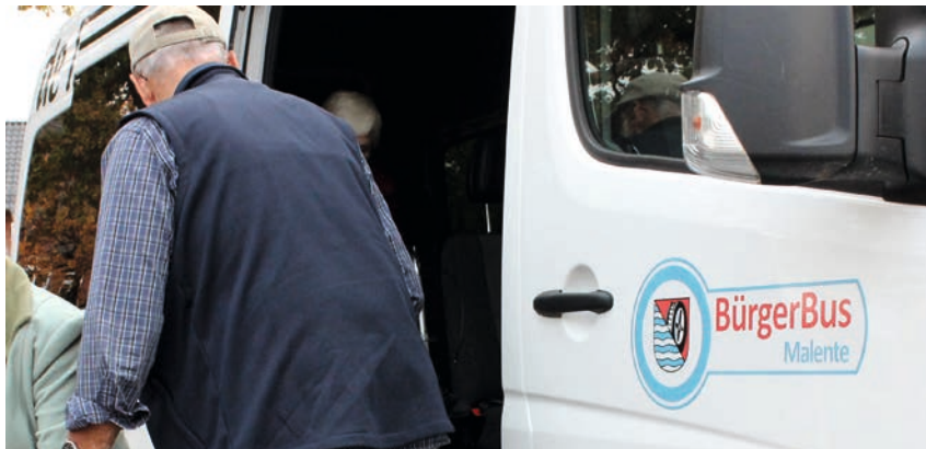
Alternative, vernetzte Mobilitätsangebote in der Kleinstadt

an Bedeutung. Gut vernetzte, alternative und flexible Mobilitätsformen sollen die innergemeindliche und (klein-)regionale Anbindung sichern. Mobilitätsdrehscheibe ist der Bahnhof.