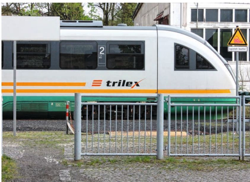
Gute überörtliche Anbindung an die Zentren

Aspekte wie Zusammengehörigkeit, Engagement, Kooperation, Miteinander, Identität und Image spielen in allen Modellvorhaben eine große Rolle. In institutionalisierter Form ist immer das Vereinsleben eine Stärke und ein wesentlicher Ort der Gemeinschaft. Es wurde jedoch deutlich, dass die Vereine und die Vereinsarbeit durch den demografischen und gesellschaftlichen Wandel unter Druck geraten. Insbesondere junge Menschen sehen ihr Engagement eher projektbezogen außerhalb fester