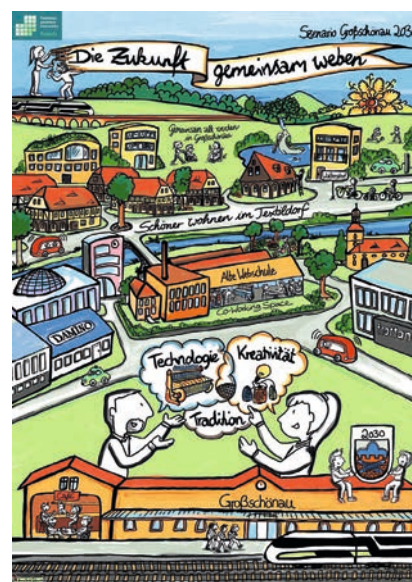
Zukunftsbild Großschönau 2030 Zeichnung: Anna Luise Sulimma