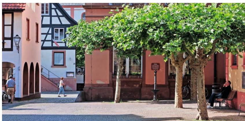
Kleinstädtische Lebensweise mit eigenen Qualitäten

Sprechen wir von Urbanität oder einer urbanen Stadt, meinen wir ganz allgemein ein vielgestaltiges, tolerantes und lebendiges Leben in der Stadt. Wie dieses Leben im Einzelnen aussehen kann und soll, darüber gibt es ganz unterschiedliche Vorstellungen. Gerade das erlaubt es, den Begriff Urbanität auch auf die Kleinstadt anzuwenden und mit Leben zu füllen. Er muss auch nicht auf ein breitgefächert qualitativ wie quantitatives hohes Angebot an kulturellen Einrichtungen, gastronomischen Angeboten und Konsumgütern mit immer schnelleren Wechsels verengt bleiben. Sie sind sicherlich ein Teil einer lebendigen Stadtkultur – aber auch nur