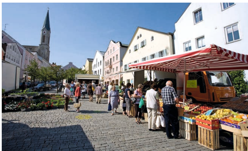
Treffpunkte und Orte der Gemeinschaft

Ausgehend von den eigenen wirtschaftlichen Potenzialen und Traditionen sollen aus Sicht der Szenariogruppenmitglieder neue Ansätze wirtschaftlicher Entwicklung angestoßen werden. Sie sehen als Zukunftsoptionen eher Dienstleistungen und Wissensökonomie, weniger Gewerbe und Industrie, können dies aber nur schwer konkret fassen. Tradition und Bewährtes sollen mit Moderne und Kreativität verbunden werden. Ein häufig benannter Entwicklungsmotor war dabei ein Innovations- und Gründerzentrum, das als Institution und Ort in der Stadt das Thema besetzt. Auch wenn teilweise noch unklar ist, wie und mit wem diese Zentren mit Leben gefüllt werden sollen. In einigen Szenariogeschichten sind daraus Orte für das Arbeiten der Zukunft – Coworking-Spaces, Innovation Labs, FabLabs und MakerSpaces als Third Places – entstanden. Sie entstehen in alten Schulen oder Fabriken und bieten die Möglichkeiten, Ruhe, Regionalität und Landschaftsbezug der Kleinstadt mit Kreativität und Innovation zu verbinden. Gleichzeitig sollen sie Schülern und Jugendlichen auch als kleinstädti-