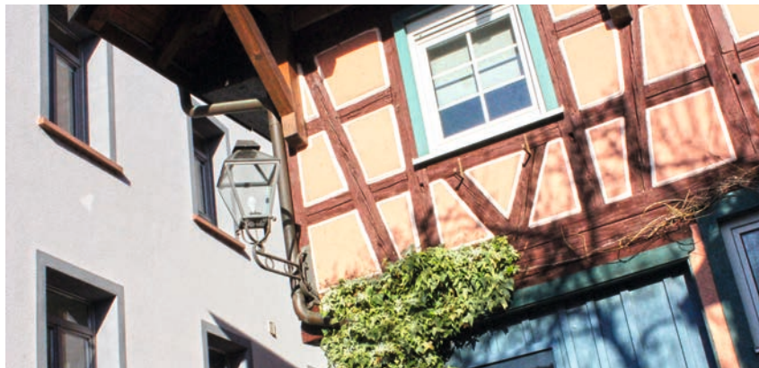
Wohnen in der Kleinstadt – Mischung aus klassischen und modernen Angeboten

In den Szenarioprozessen haben sich die Mitglieder der Szenariogruppen mit den Potenzialen, den Einflussfaktoren auf die Entwicklung ihrer Stadt und den Zielen und Wünschen für die Zukunft in einem moderierten Prozess auseinandergesetzt. Dabei hat sich gezeigt, dass bestimmte Themen und Handlungsfelder die Szenariodiskussionen dominierten und in unterschiedlichen Varianten in allen Modellvorhaben relevant waren. Übersetzt in die Zukunftsbilder und Szenariogeschichten zeigen sie, wie die Szenariogruppen sich die kleinstädtische Lebensweise in ihrer Stadt, in ihrer „Urbanen Kleinstadt“ wünschen. Sicherlich sind es „lediglich“ Wunschbilder eines ausgewählten Kreises, deren Umsetzungschancen unsicher sind. Dennoch zeichnen sie durchaus mögliche, vielgestaltige Bilder der Modellvorhaben ab. Auch wenn sich die nachfolgenden Thesen und Aussagen auf die acht Modellvorhaben beziehen, kann vermutet werden, dass die Handlungsfelder und Wunschbilder typisch und relevant für eine Vielzahl von Kleinstädten in peripheren Lagen sind.