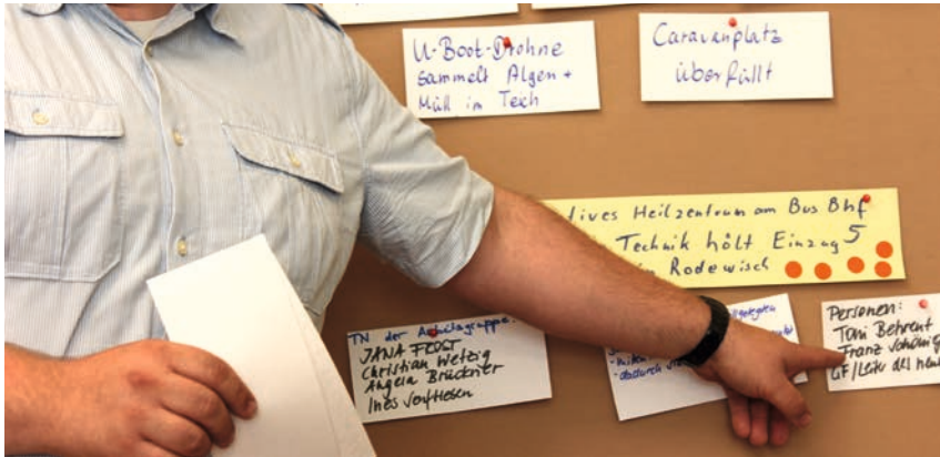
Von der Projektidee zur Umsetzung

Zum Abschluss des ExWoSt-Forschungsfeldes haben die beteiligten Kleinstädte aus ihrer Sicht wichtige Erfolgsfaktoren und Hemmnisse von Prozessen kooperativer Kleinstadtplanung zusammengefasst: