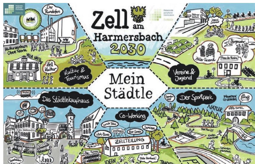
Zukunftsbild Zell am Harmersbach 2030 Zeichnung: Anna Luise Sulimma