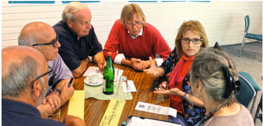
Kommunikation als Kern kooperativer Prozesse

Die in den Modellvorhaben des Forschungsfeldes durchgeführten Szenarioprozesse und darüber hinaus angewandten weiteren Beteiligungsformate haben gezeigt, dass intensive Bürgerbeteiligung und Kommunikation wesentliche Faktoren sind, um neue tragfähige Potenziale zu erschließen. Kooperative Kleinstadtentwicklung ist der Weg, der als Daueraufgabe zu gestalten ist. Es handelt sich dabei um einen partnerschaftlichen und arbeitsteiligen Prozess zwischen Stadtgesellschaft, lokaler Wirtschaft, Politik und Verwaltung mit dem Ziel eines guten Lebens in ihrer Kleinstadt.