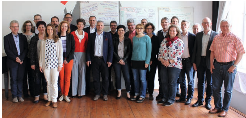
Vertreterinnen und Vertreter aus den Modellvorhaben bei der fünften Erfahrungswerkstatt in Großschönau