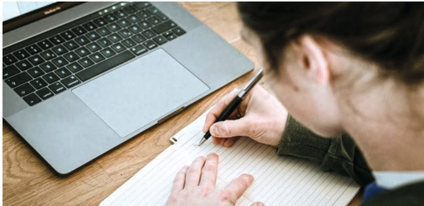
Kreativität und Bildung als Schlüssel für neue Ideen