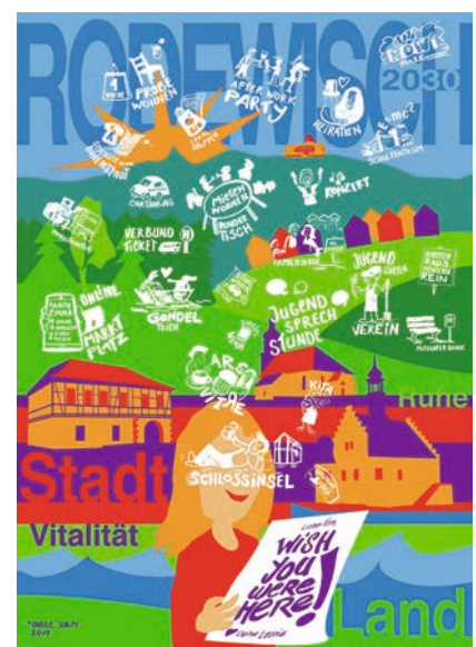
Zukunftsbild Rodewisch 2030 Zeichnung: Gabriele Schlipf