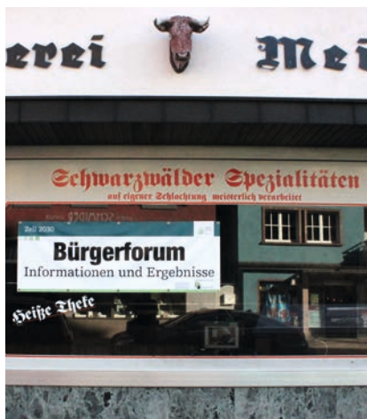
Zusammenarbeit in der Kleinstadt

Im Rahmen der Szenariodiskussionen spielte in vielen Modellvorhaben die Digitalisierung gerade bei der Frage der Einflussfaktoren eine große Rolle. Deutlich wurde hier, dass die sich mit der Digitalisierung gegebenen Chancen nur nutzen lassen, wenn eine gute Infrastruktur eine hervorragende Netzverfügbarkeit bietet. Im Laufe der Diskussionen entwickelte sich die Digi-