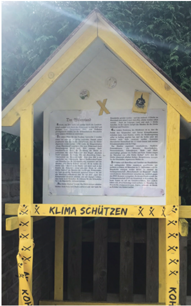
Impressionen aus Kuckum-Alt