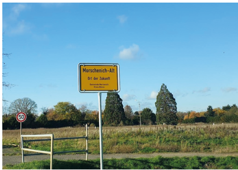
Impression aus Morschenich-Alt

Morschenich-Alt ist Teil der Gemeinde Merzenich in Nordrhein-Westfalen und Anrainerkommune des Tagebaus Hambach. Bereits 1977 erfolgte mit der Aufstellung des Braunkohleplans die für 2024 geplante bergbauliche Inanspruchnahme des Ortes. Die Umsiedlung an den Ersatzstandort Morschenich-Neu nordöstlich von Merzenich begann 2013 und soll voraussichtlich 2024 ihren Abschluss finden. Verbunden mit dem Ausstieg aus der Braunkohleverstromung bis 2030 sowie den Klimaprotesten zum Erhalt des Hambacher Forsts, konnte 2020 die Nichtinanspruchnahme des Dorfes Morschenich-Alt vereinbart werden. Der Umgang mit der alten Ortslage stellt ein kontroverses Thema dar. Das Dorf ist weitestgehend leergezogen und bis auf wenige Grundstücke in Eigentümerschaft der RWE (vgl. Finkenberger 2022). Seine Revitalisierung und Entwicklung zum „Ort der Zukunft“ wird unter Beteiligung verschiedener Akteure angestrebt (vgl. Gelhausen o. J.).