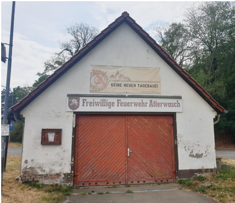
Impressionen aus Atterwasch