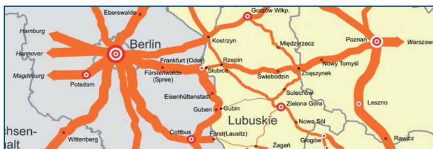
Korytarz Berlin – Poznań (– Zielona Góra)

Przedstawiciele gmin karkonoskich i Ziemi Kłodzkiej angażują się na rzecz bezpośredniego połączenia z Drezna przez Görlitz do Jeleniej Góry i dalej przez Wałbrzych do Kłodzka. Tym samym ma