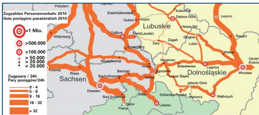
Korytarz Drezno – Wrocław (– Jelenia Góra – Wałbrzych)

zostać ulepszona dostępność dla turystów z Niemiec tego turystycznie atrakcyjnego regionu, w którym znajduje się wiele znanych kurortów. Aby to osiągnąć można rozważyć otwarcie odgałęzienia istniejącego połączenia od Görlitz przez Lubią do Jeleniej Góry. Z powodu częściowo złej infrastruktury czas podróży między Dreznem i Jelenią Górą wynosiłby prawie 3 godzin, w porównaniu z obecnym stanem oznaczałoby to, że połączenie i tak jest o wiele szybsze i tylko nieznacznie wolniejsze niż podróż samochodem. Po modernizacji takich odcinków, na których pociągi obecnie muszą wolno jeździć, czas podróży byłby o 30 min. krótszy, po modernizacji całej trasy czas podróży wynosiłby nawet mniej niż 2 godziny.